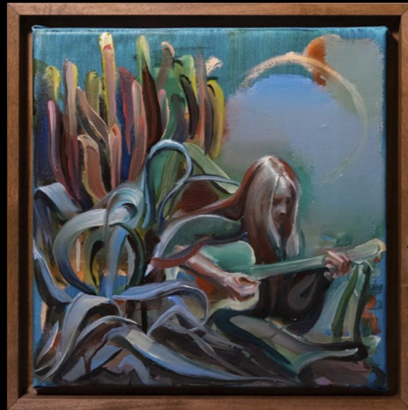
WHAT WAS I THINKIN', 2022