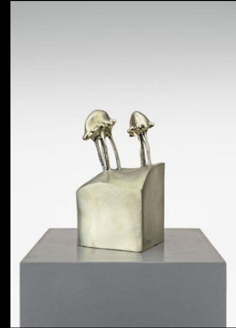
MEDUSA (1), 2023

Für weitere Informationen zu den Editionen / For further information on the editions: a.kowalewsky@dcv-books.com