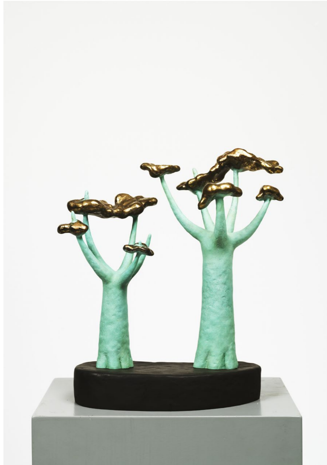
Zwei Linden / Two Linden Trees, 2021

RETROSPEKTIVE, FALLEN FALLS, KUNSTHALLE ROSTOCK 17. DEZEMBER 2023 – 10. MÄRZ 2024 / DECEMBER 17, 2023 – MARCH 10, 2024