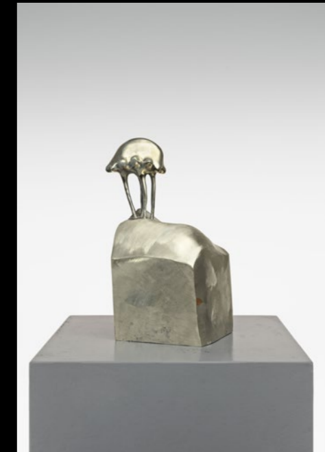
MEDUSA (2), 2023