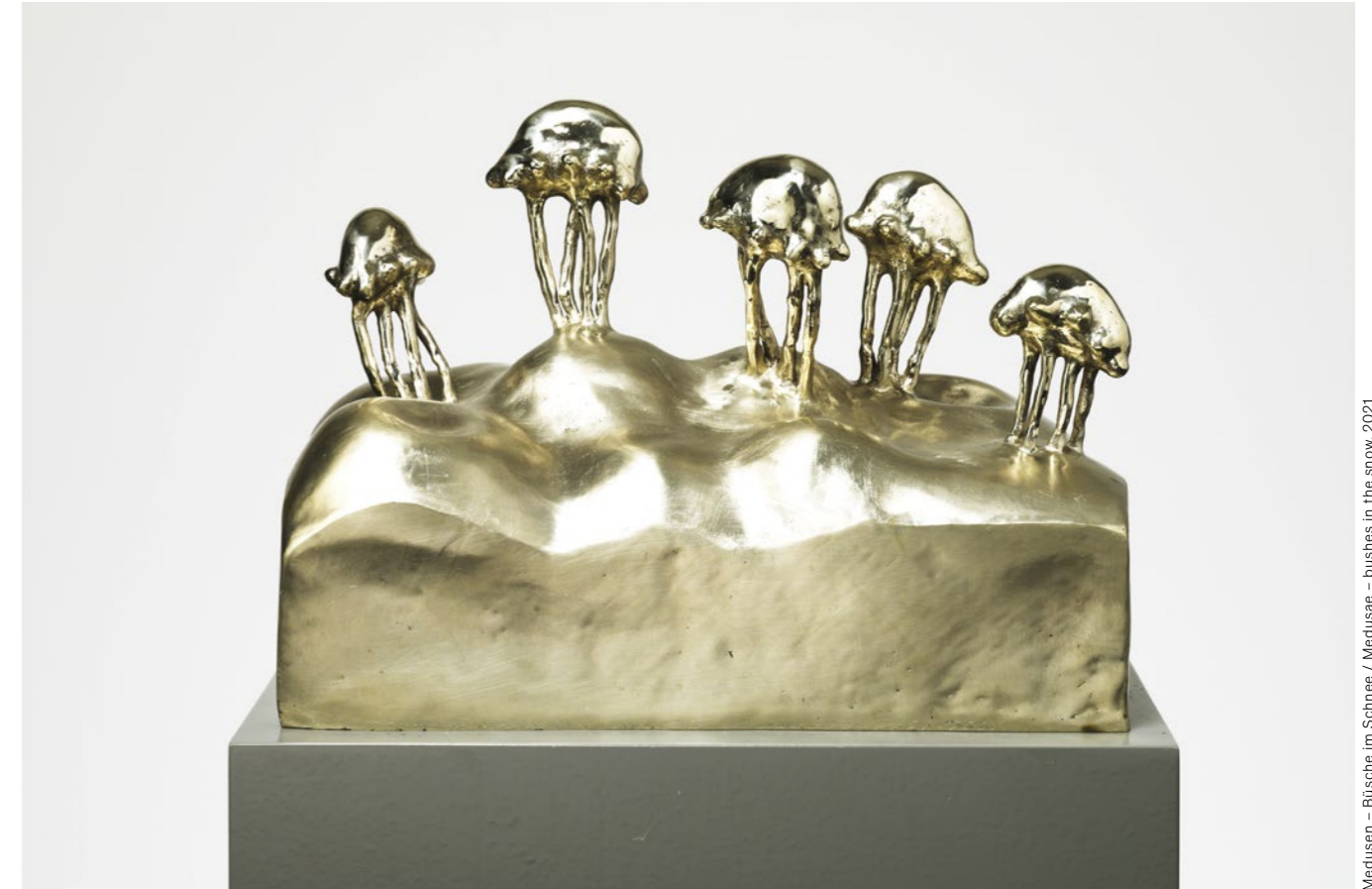
Medusen – Büsche im Schnee / Medusae – bushes in the snow, 2021

RETROSPEKTIVE, FALLEN FALLS, KUNSTHALLE ROSTOCK 17. DEZEMBER 2023 – 10. MÄRZ 2024 / DECEMBER 17, 2023 – MARCH 10, 2024