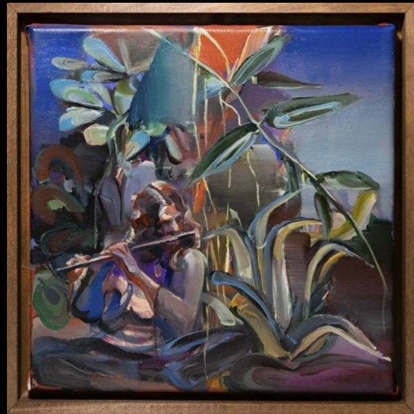
WAYWARD WIND, 2022

Für weitere Informationen zu den Editionen / For further information on the editions: a.kowalewsky@dcv-books.com