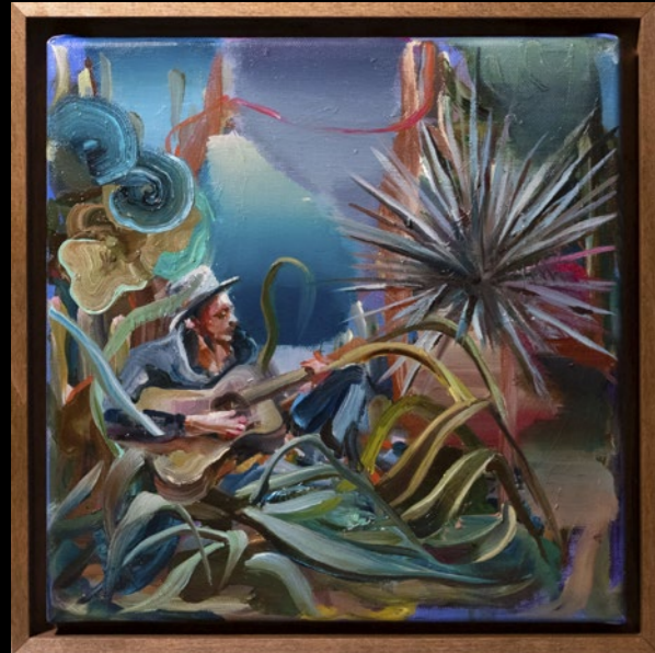
SOUTH OF THE BORDER, 2022

4 Unikate / 4 unique works Öl auf Leinwand / Oil on canvas, 30 × 30 cm, gerahmt, signiert / framed, signed